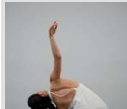
DAB dantza konpainia

DAB dantza konpainia , por su parte, afronta un año estratégico con el estreno de su nueva obra NCEUD que toma como referencia las metodologías de trabajo que tenían en común Eduardo Chillida y Cristóbal Balenciaga . Así que "esta mentorización llega en un gran momento de la compañía ya que lo aprovecharemos para hacer crecer la estructura de la misma".