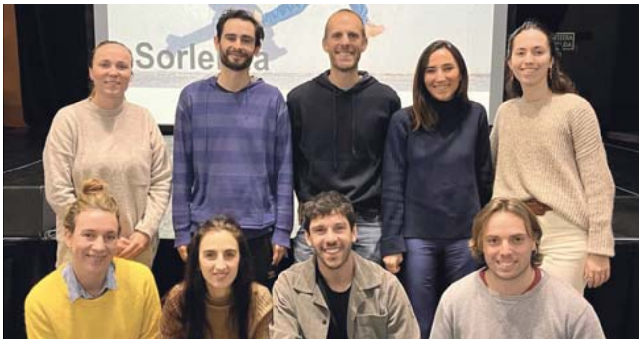
Participantes en la primera convocatoria de Sorlekua Mentoretza